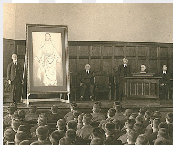
写真1 中央講堂での除幕式

寄贈後の《平和の基督》は、時計台(旧大学図書館)内に飾られた(写真2)。その後、「額装」が「軸装」に変わり、現在は学院史編纂室に所蔵されている。